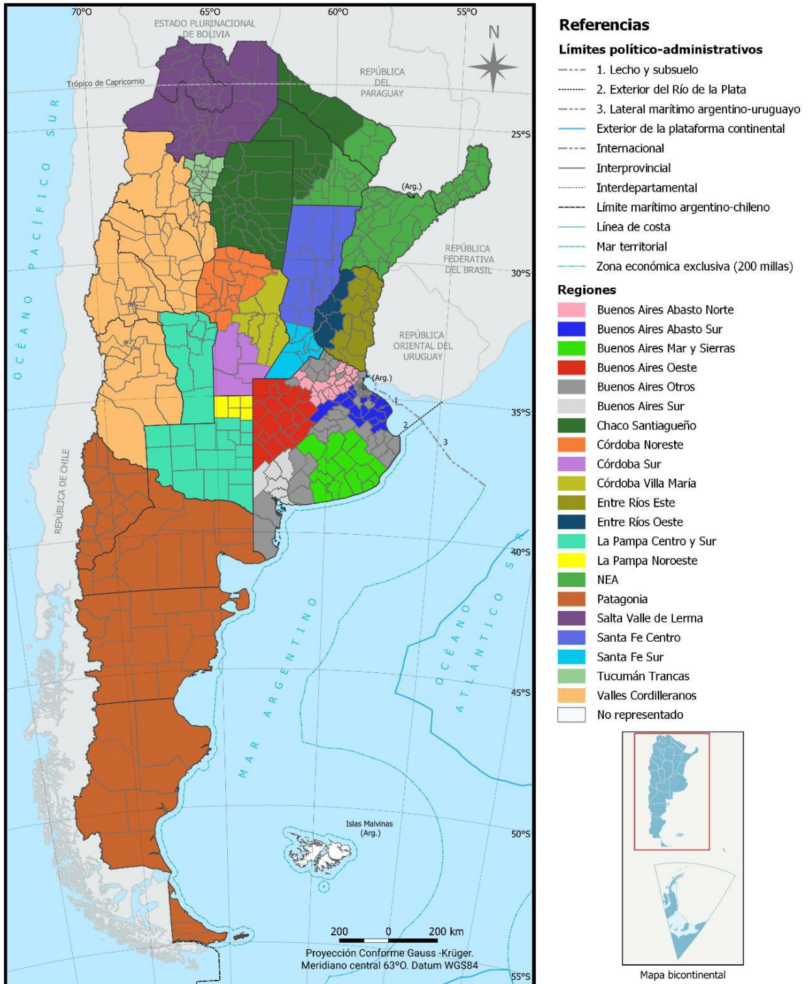
Ilustración 3: Regionalización del país según Sistema Modal de ganadería de leche.