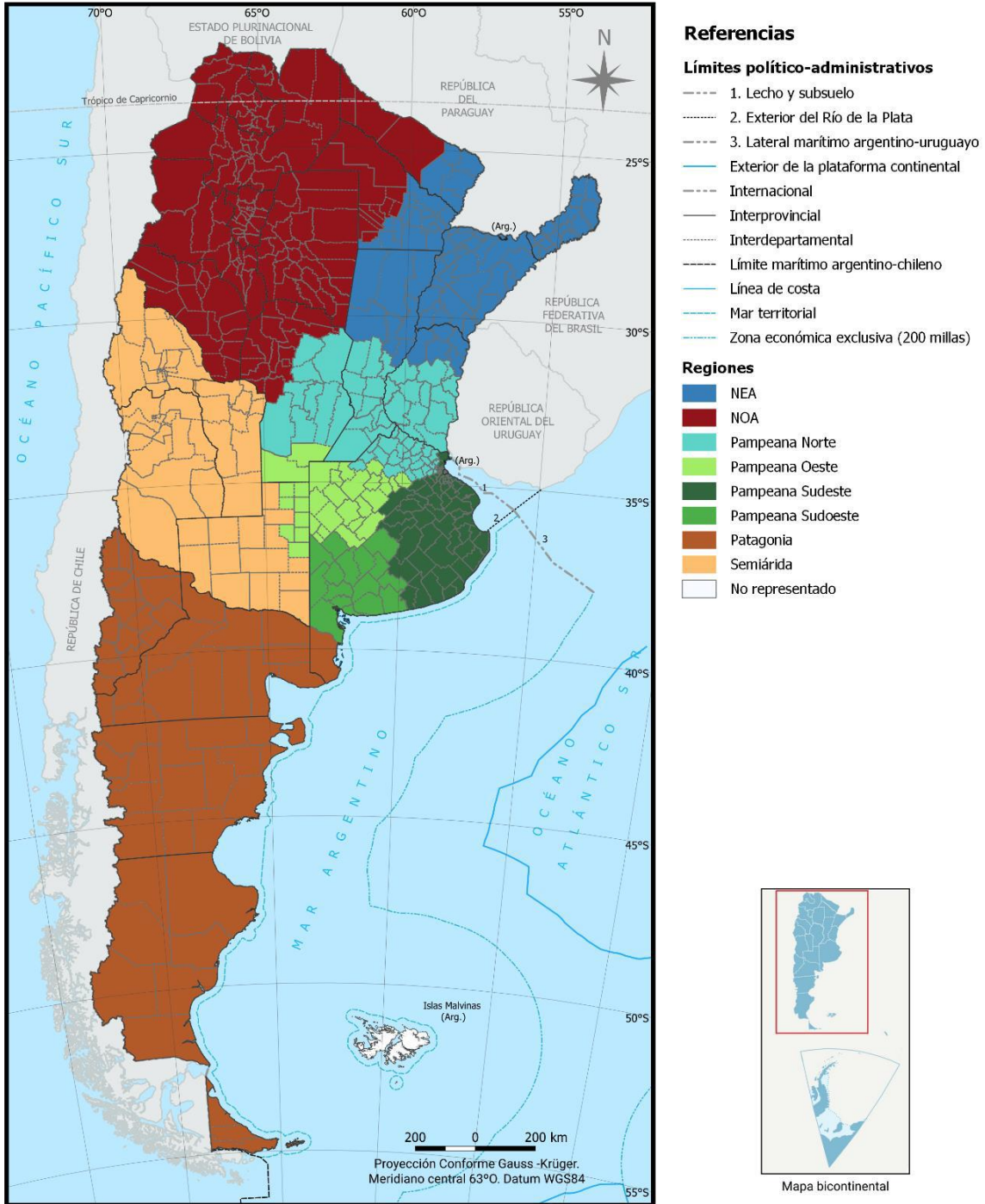
Ilustración 2: Regionalización del país según Sistema Modal de ganadería de carne.